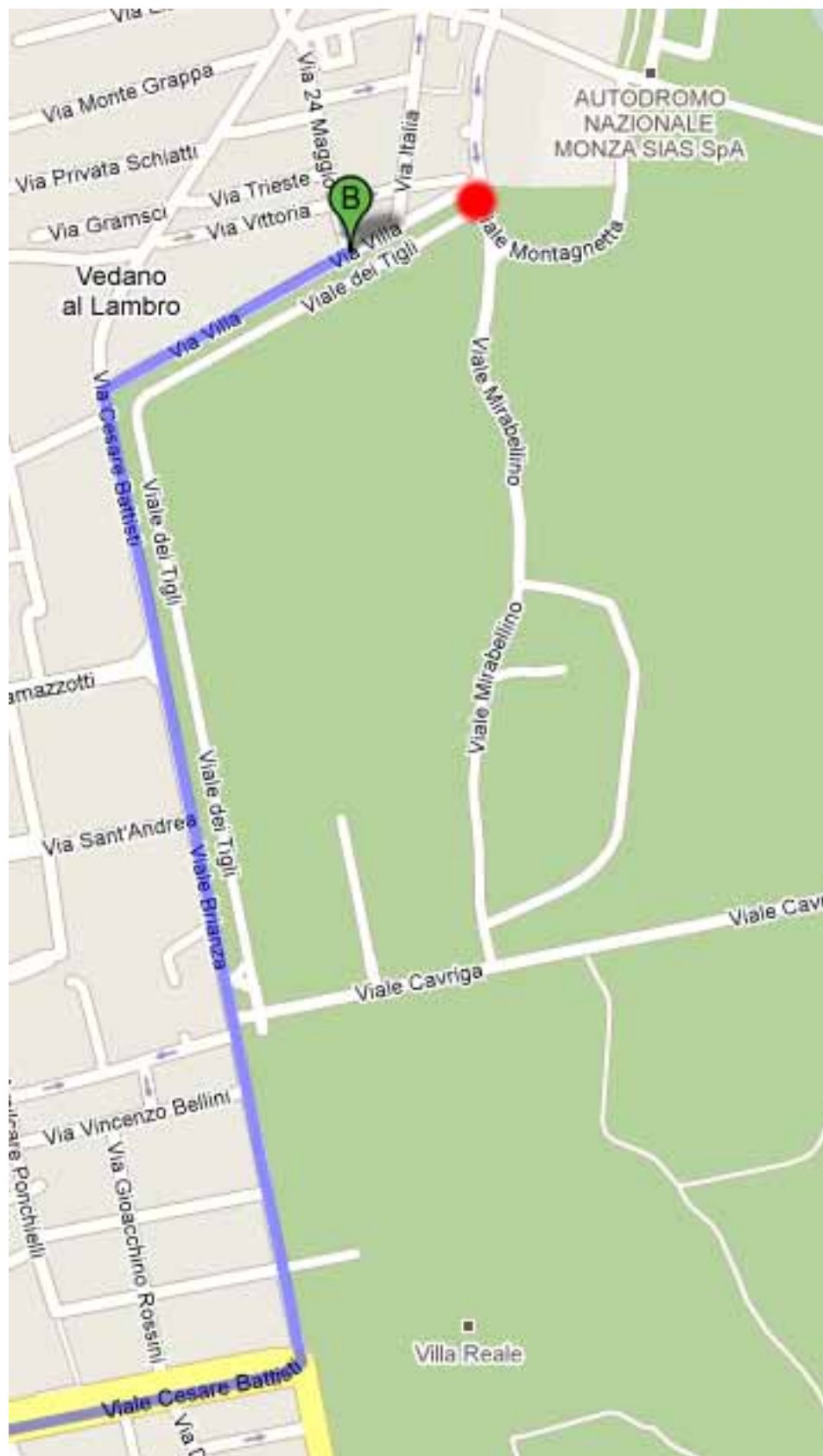
Figura 1 - Dalla Villa Reale fino all'ingresso dell'autodromo (in rosso in figura)