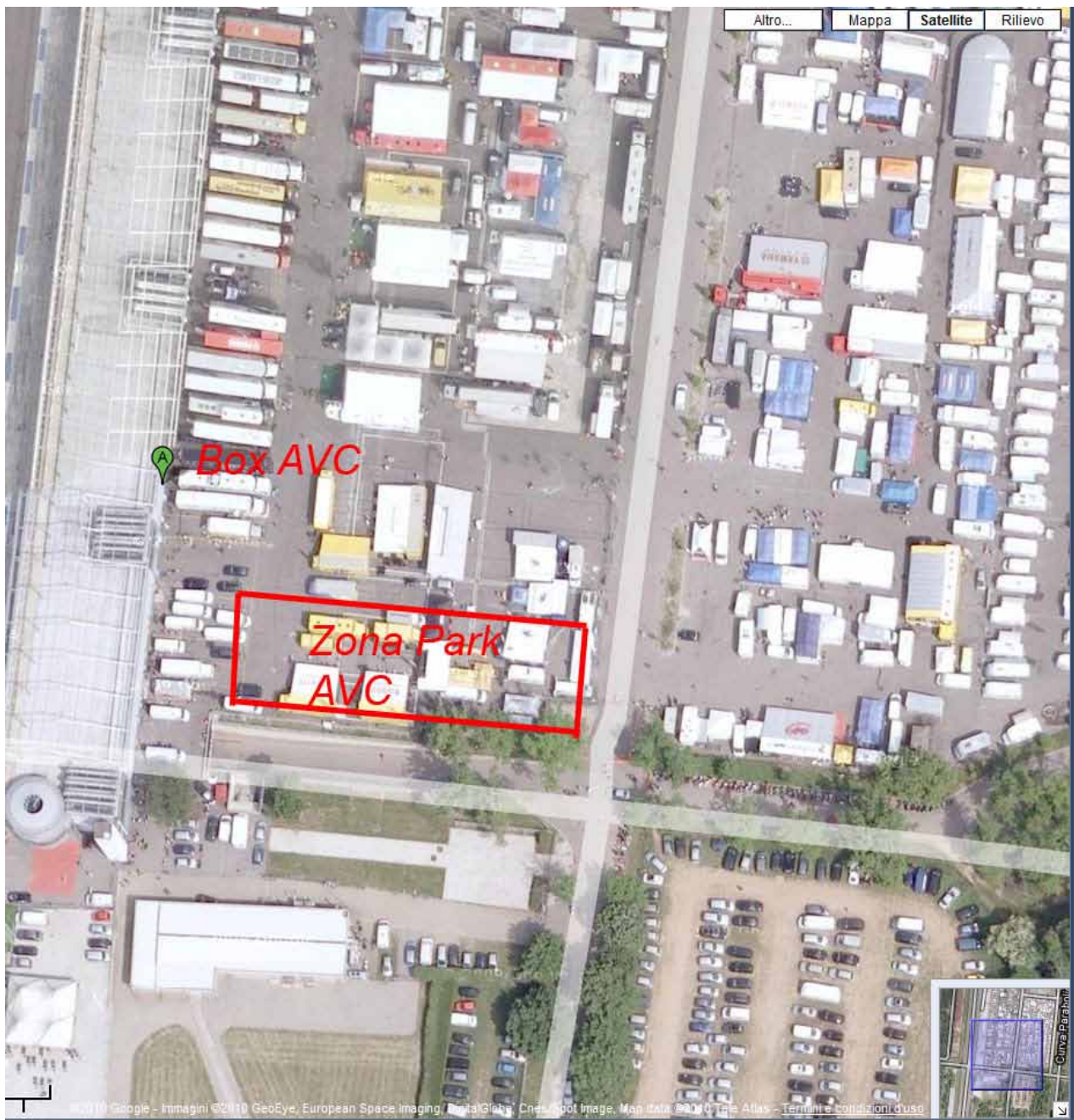
Figura 4 –zone principali di interesse